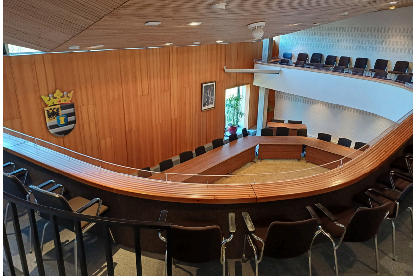
De raadzaal van de gemeente Stadskanaal